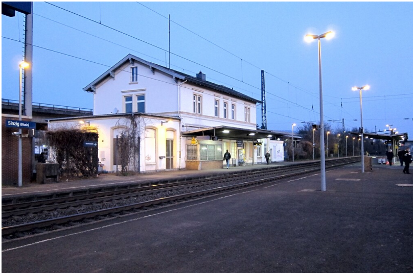
Empfangsgebäude des Bahnhofs Sinzig (2014)