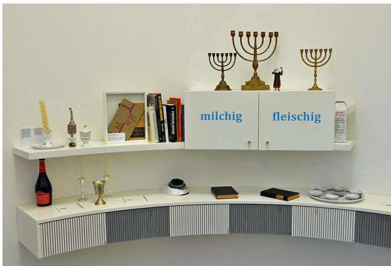
Objekte und Elemente jüdischer Kultur in der Ausstellung in der Begegnungsstätte "Alte Synagoge" in Wuppertal-Elberfeld (2014).