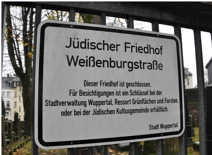
Hinweisschild mit Informationen zur Möglichkeit von Besichtigungen am alten jüdischen Friedhof Weißenburgstraße in Elberfeld-Ostersbaum (2014).