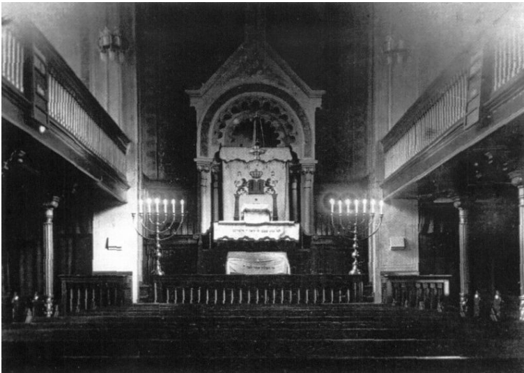
Innenraum der Alten Synagoge in Elberfeld mit Blick auf den Thoraschrein (Aufnahme zwischen 1865 und 1875).