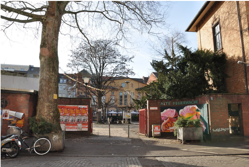
Eingang zum Bürgerzentrum Alte Feuerwache (2014)