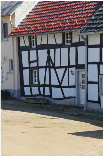
Fachwerkhaus in Bongard (2019)