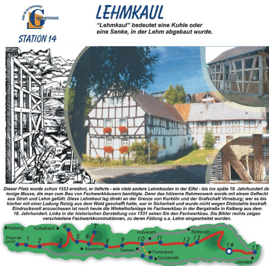
Dieser Platz wurde schon 1553 erwähnt, er lieferte - wie viele andere Lehmkaulen in der Eifel - bis ins späte 19. Jahrhundert die tonige Masse, die man zum Bau von Fachwerkhäusern benötigte. Denn das hölzerne Rahmenwerk wurde mit einem Geflecht aus Stroh und Lehm gefüllt. Diese Lehmkaul lag direkt an der Grenze von Kurköln und der Grafschaft Virneburg; wer es bis hierher mit einer Ladung Reisig aus dem Wald geschafft hatte, war in Sicherheit und wurde nicht wegen Diebstahls bestraft. Eindrucksvoll anzuschauen ist noch heute die Winkelhofanlage im Fachwerkbau in der Bergstraße in Kelberg aus dem 18. Jahrhundert. Links in der historischen Darstellung von 1531 sehen Sie den Fachwerkbau. Die Bilder rechts zeigen verschiedene Fachwerkkonstruktionen, zu deren Füllung u.a. Lehm eingesetzt wurden.