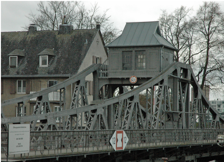
Deutzer Drehbrücke mit Steuerungshäuschen (2014)