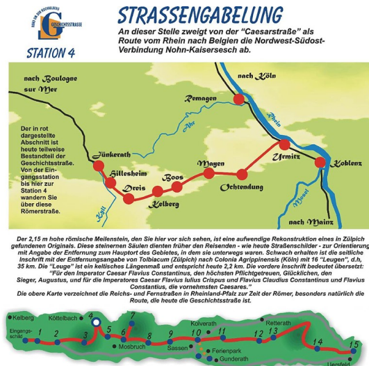
Informationstafel, Erster Abschnitt der Geschichtsstraße: Station 4.