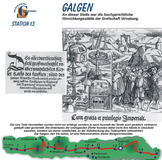
Informationstafel, Erster Abschnitt der Geschichtsstraße Kelberg: Station 13 "Galgen" mit einem Ausschnitt des Titelkupfers der "Constitutio Criminalis Carolina" von 1532.