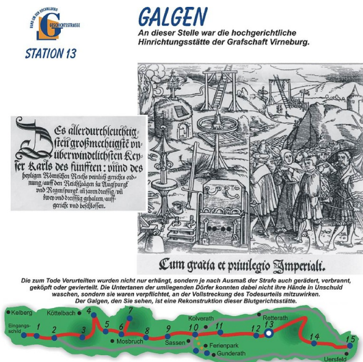
Informationstafel, Erster Abschnitt der Geschichtsstraße Kelberg: Station 13 "Galgen" mit einem Ausschnitt des Titelkupfers der "Constitutio Criminalis Carolina" von 1532.