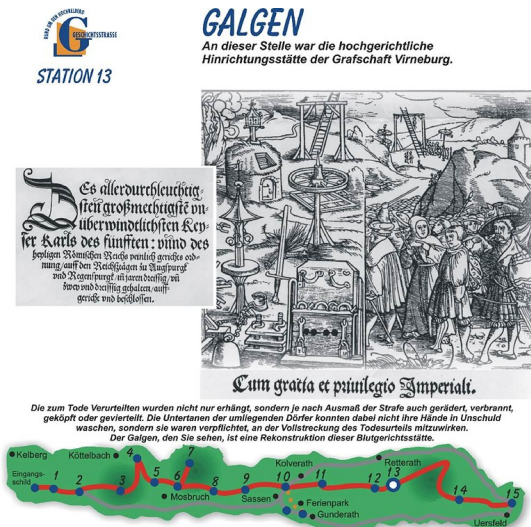
Informationstafel, Erster Abschnitt der Geschichtsstraße Kelberg: Station 13 "Galgen" mit einem Ausschnitt des Titelkupfers der "Constitutio Criminalis Carolina" von 1532.