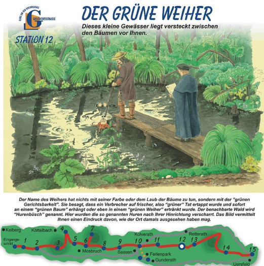
Informationstafel, Erster Abschnitt der Geschichtsstraße: Station 12 Grüner Weiher.