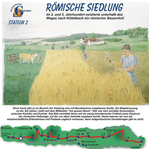
Informationstafel, Erster Abschnitt der Geschichtsstraße: Station 2, römische Siedlung.