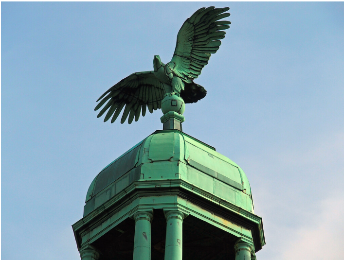
Regierungspräsidium Düsseldorf (2015) Fotograf/Urheber: Karl Peter Wiemer