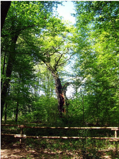
Die "tausendjährige" Boxhohn-Eiche hinter dem schützenden Holzgitter (2014)