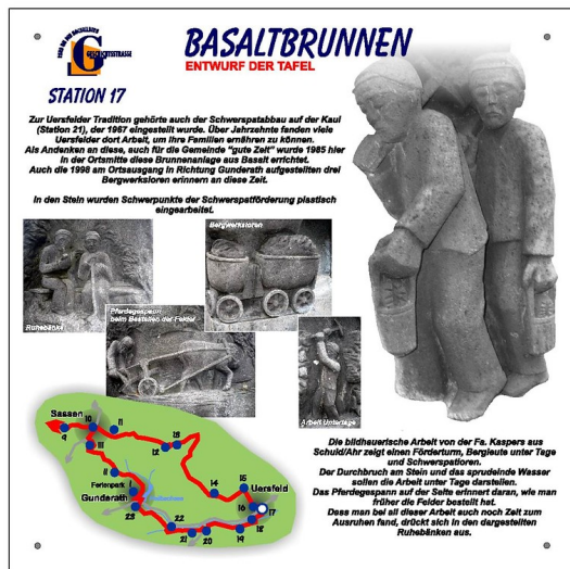
Informationstafel, Geschichtsstraße Abschnitt 1: Route Uersfeld-Gunderath, Station 17 Basaltbrunnen.