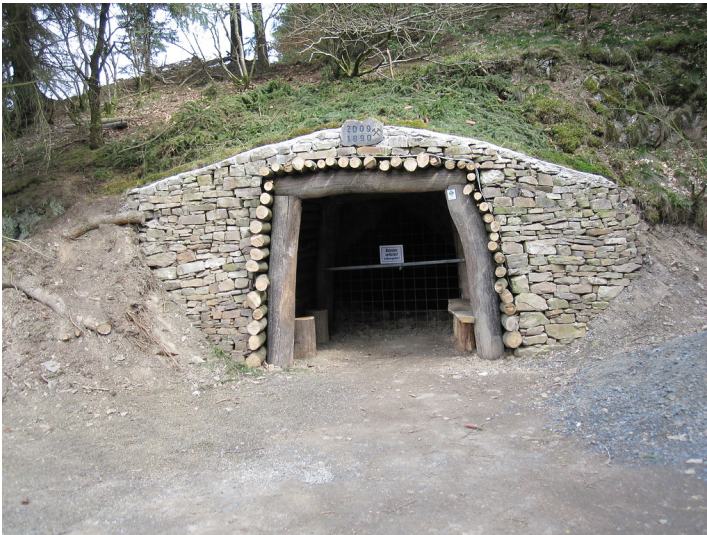
Eingang zum Schutzstollen bei Uersfeld (2010) - Station 20 der Geschichtsstraße, Abschnitt 1