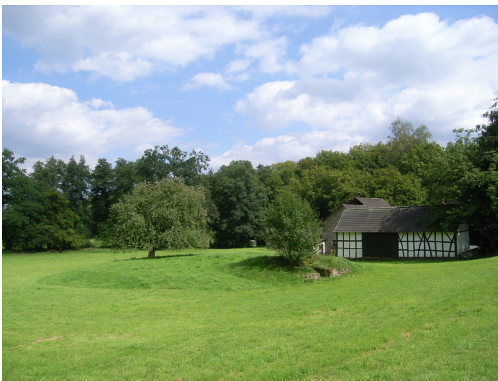
Motte Ravenstein in Hennef (Sieg) (2011)

Bundesland: Nordrhein-Westfalen, Rheinland-Pfalz