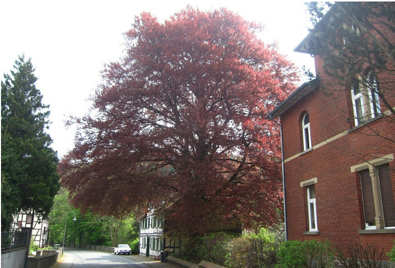
Die Blutbuche in der Siegtalstraße in Windeck-Herchen (2014)