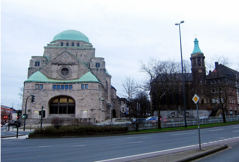
Die Alte Synagoge Essen (links) und die Altkatholische Friedenskirche (rechts), Ansicht von von der L448 / Schützenbahn aus (2014).

Schlagwörter: Kirchengebäude , Kirche (Institution) Fachsicht(en): Kulturlandschaftspflege, Landeskunde Gemeinde(n): Essen (Nordrhein-Westfalen) Kreis(e): Essen (Nordrhein-Westfalen) Bundesland: Nordrhein-Westfalen