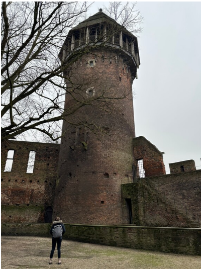
Ansicht des Bergfrieds der Burg Linn vom Innenhof aus (2025). Die Burg ist heute Teil des Museums Burg Linn, das die Geschichte des Ortes und der Umgebung von der Antike bis in die Neuzeit beleuchtet.