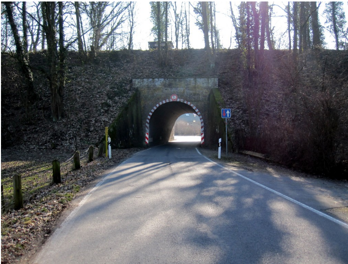
Unterführung im Bahndamm der Boxteler Bahn in Uedemerbruch für die Straße "Dorf" (2011)