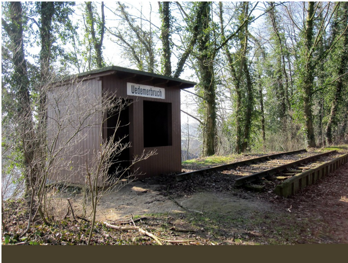
Haltestelle Uedemerbruch der Boxteler Bahn (2011)