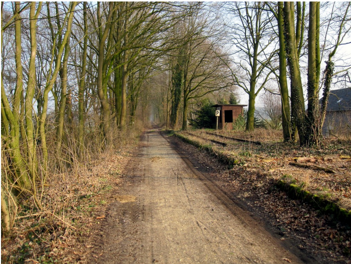
Haltestelle Uedemerfeld der Boxteler Bahn und Bahndamm (2011)