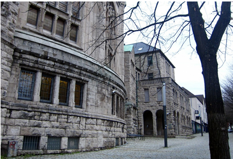
Das Rabbinerhaus hinter der Südseite der Alten Synagoge Essen (2014).