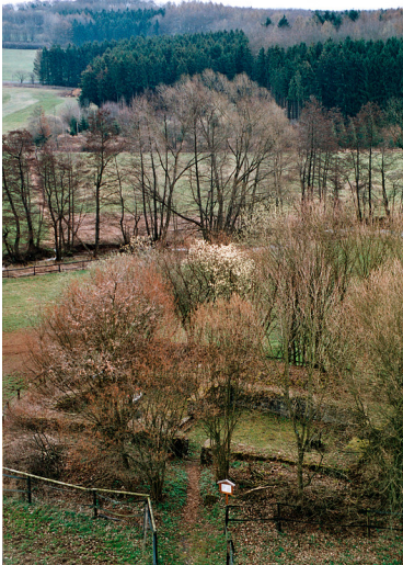
Die Stumpe Kirch, die sogenannte Marcellinuskirche bei Schotten-Burkhards im Vogelsbergkreis von Nordwesten aus gesehen (2004)