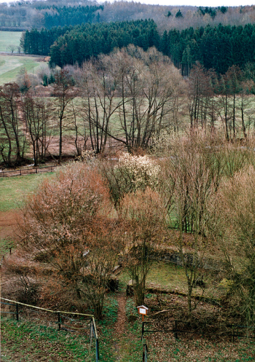
Die Stumpe Kirch, die sogenannte Marcellinuskirche bei Schotten-Burkhards im Vogelsbergkreis von Nordwesten aus gesehen (2004)