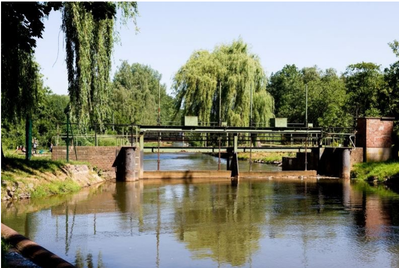
Wehranlage der Zievericher Mühle