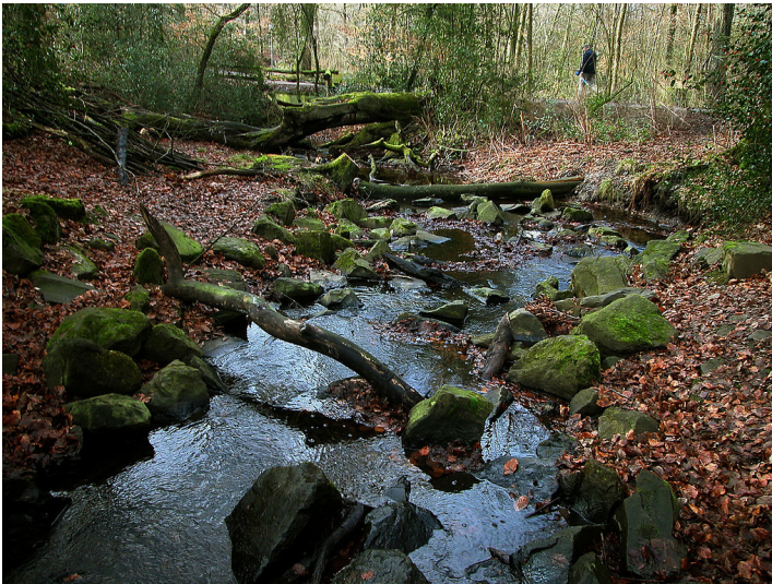
Bachlauf im Nachtigallental im Duisburger Stadtwald (2011).