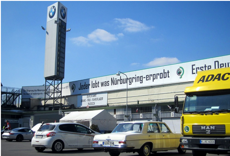
Innenbereich des historischen Fahrerlagers und ein moderner Anzeigturm mit BMW-Werbung am Nürburgring (2013).