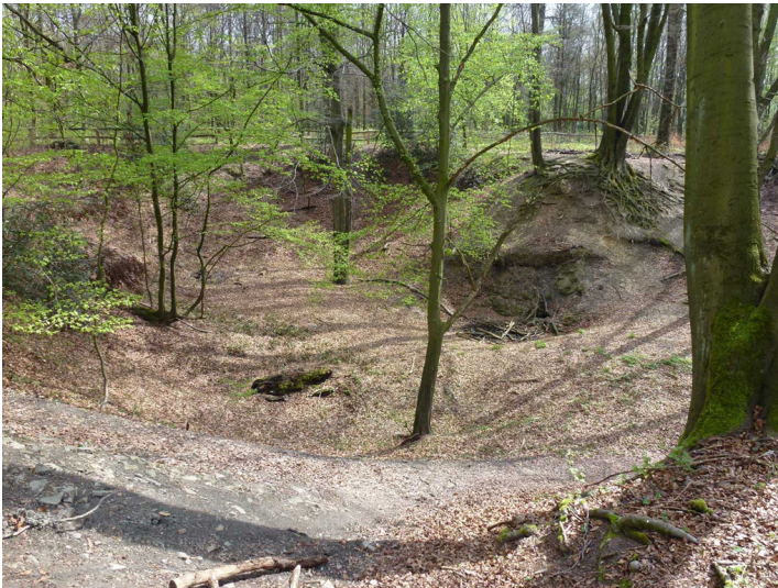
Der alte Steinbruch im Duisburger Stadtwald (2014).