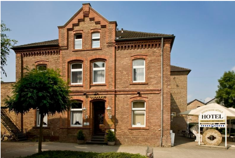
Backsteingebäude der Bedburger Mühle (2009)