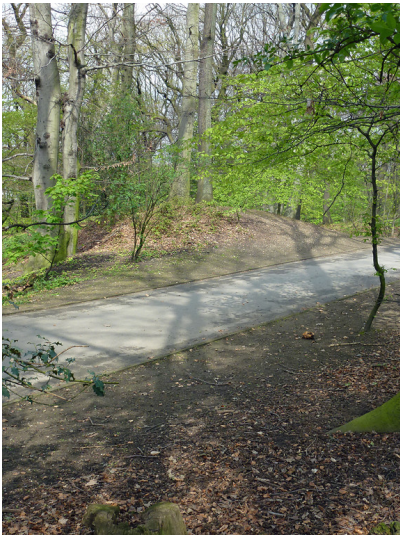
Wall-Graben-Anlagen am Duisburger Kaiserberg (2012).