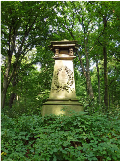
Das Curtius-Denkmal auf dem Kaiserberg (2012).