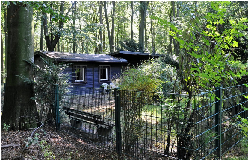
Die ehemalige Polizeiwache im Duisburger Stadtwald (2016).