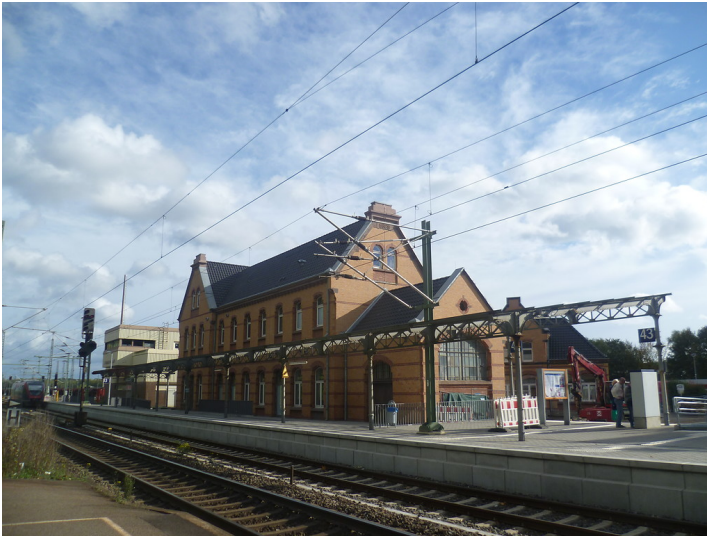
Bahnhof Stolberg mit Empfangsgebäude und Stellwerk Sf (2013)