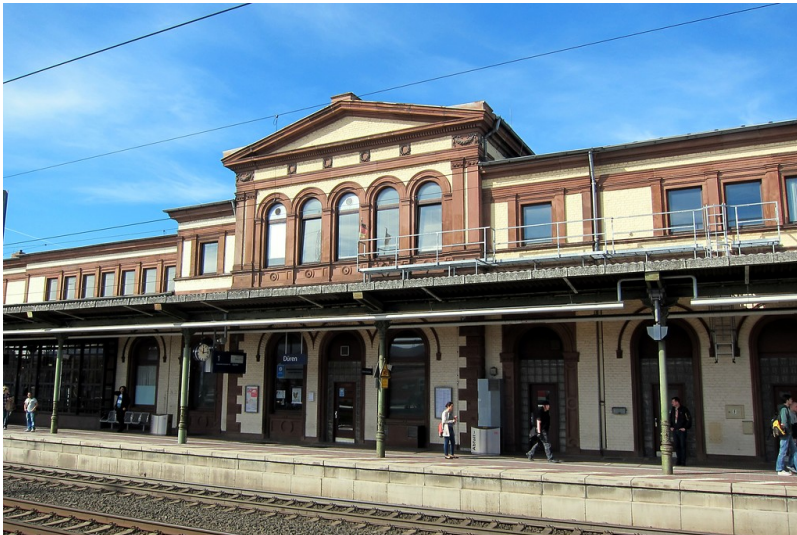
Empfangsgebäude von 1874 des Bahnhofs Düren mit dem Bahnsteig von Gleis 1 (2014).