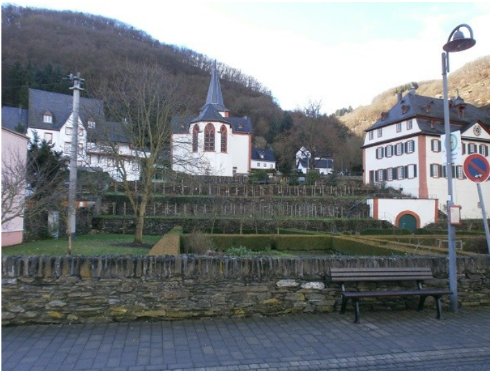
Teilansicht der Propstei Hirzenach mit dem Propsteigarten in Boppard vom Rheinufer aus gesehen (2014)