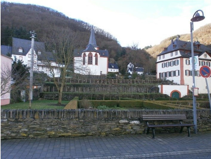
Teilansicht der Propstei Hirzenach mit dem Propsteigarten in Boppard vom Rheinufer aus gesehen (2014)