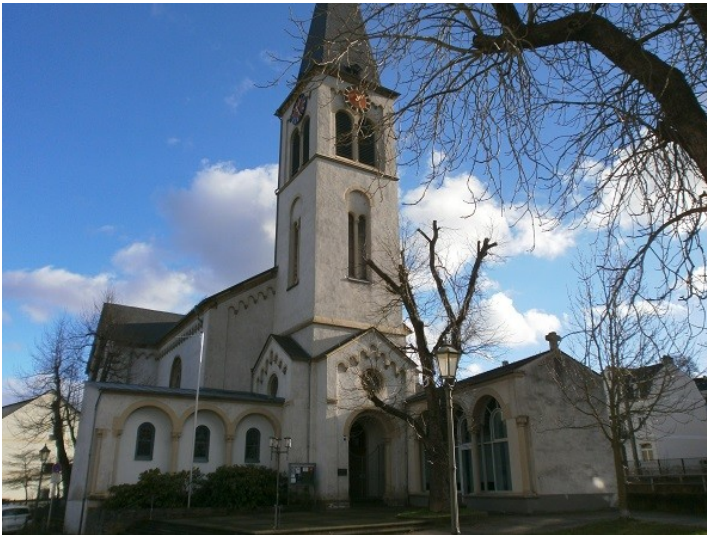
Die Evangelische Christuskirche in Boppard am Rhein (2014).