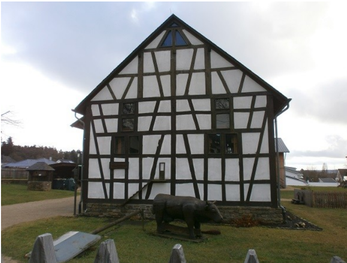
Hauptgebäude des Agrarhistorischen Museums in Emmelshausen (2014)