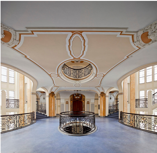
Treppenhaus des Oberlandesgerichts in Düsseldorf-Pempelfort (2011)