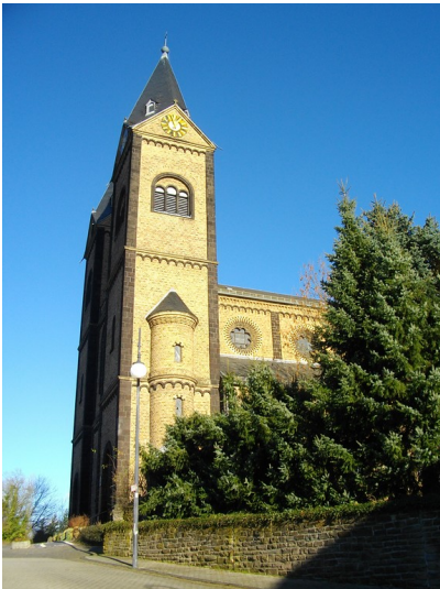
Teilsicht der katholischen Pfarr- und Wallfahrtskirche Sankt Nikolaus in Koblenz-Arenberg (2008)