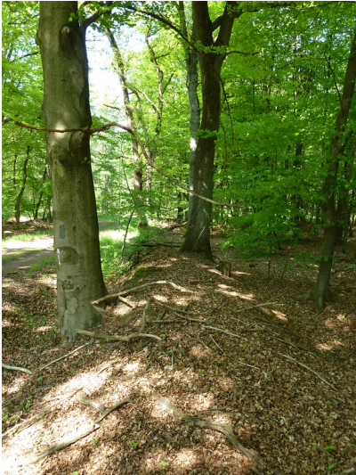
Rest einer Umwallung einer ehemaligen Forstkultur im Dämmerwald (2012)