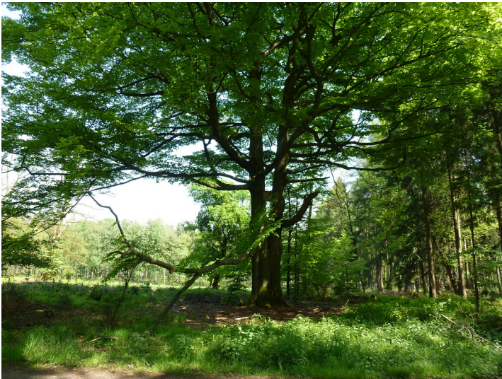
Alter Hutebaum westlich des Jägerheideweges im Dämmerwald bei Schermbeck (2012)