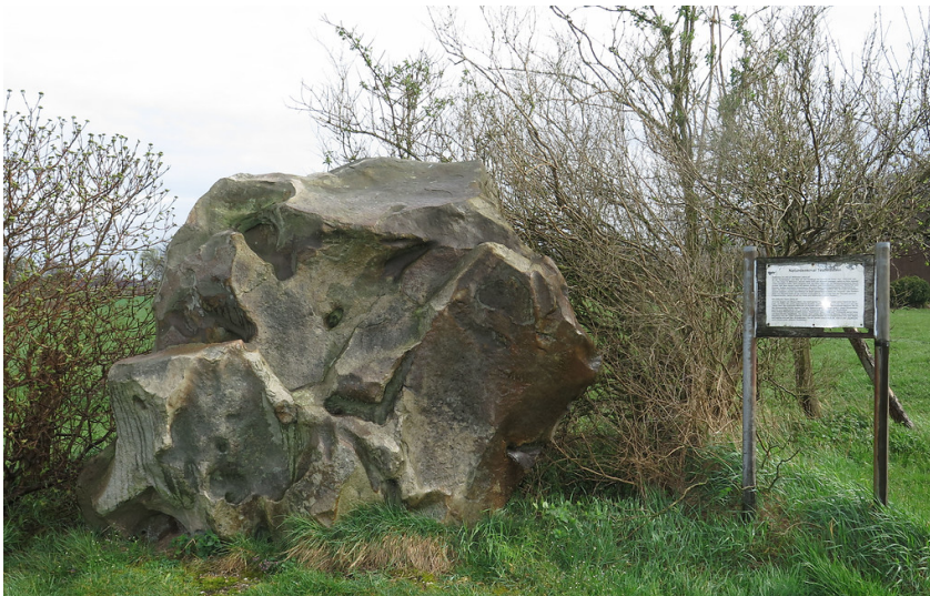
Der Teufelsstein im Ortsteil Weselerwald ist ein einzigartiges Naturdenkmal innerhalb der Gemeinde Schermbeck (2014).