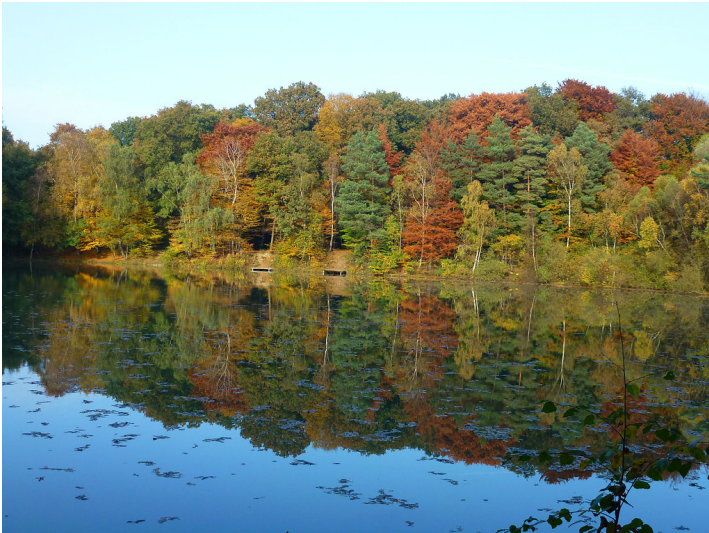
Weiher im Naturschutzgebiet Lichtenhagen im Dämmerwald (2012). Der Weiher ist durch den Abbau von Lehm und Ton entstanden.