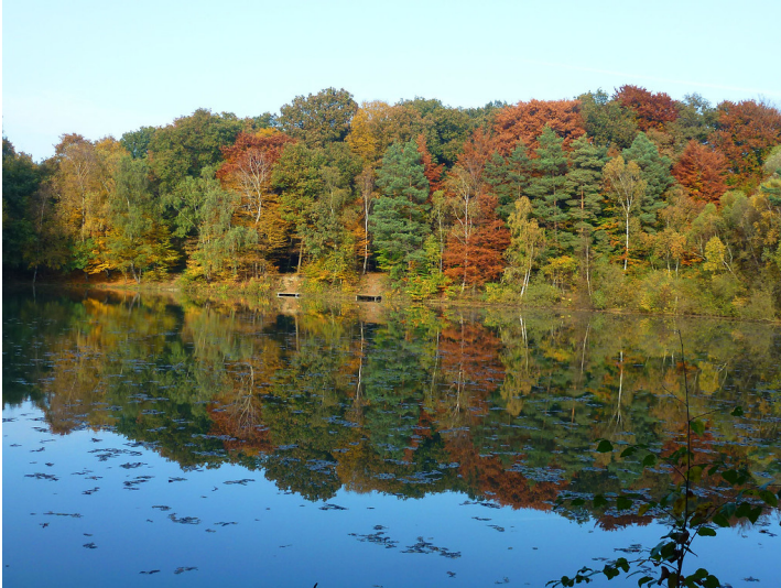
Weiher im Naturschutzgebiet Lichtenhagen im Dämmerwald (2012). Der Weiher ist durch den Abbau von Lehm und Ton entstanden.