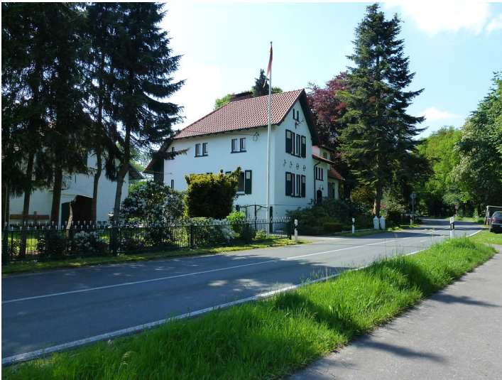
Forsthaus Malberg am Rand des Dämmerwaldes (2012)