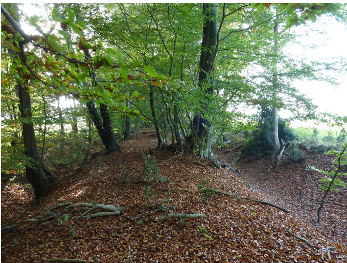
Weseler Landwehr südöstlich des Dämmerwaldes (2012); zu erkennen ist der mittlere Wall mit sich anschließenden Gräben und jeweils einem weiteren Wall.