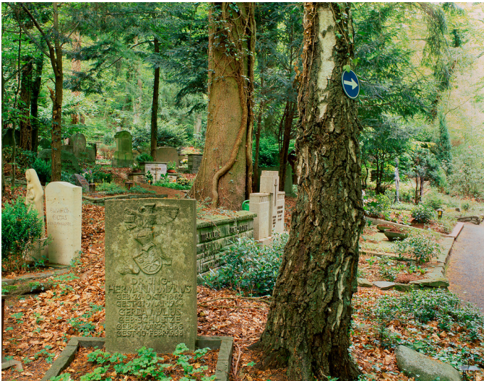
Bad Honnef-Rhöndorf, Waldfriedhof Rhöndorf, Löwenburgstr. 75