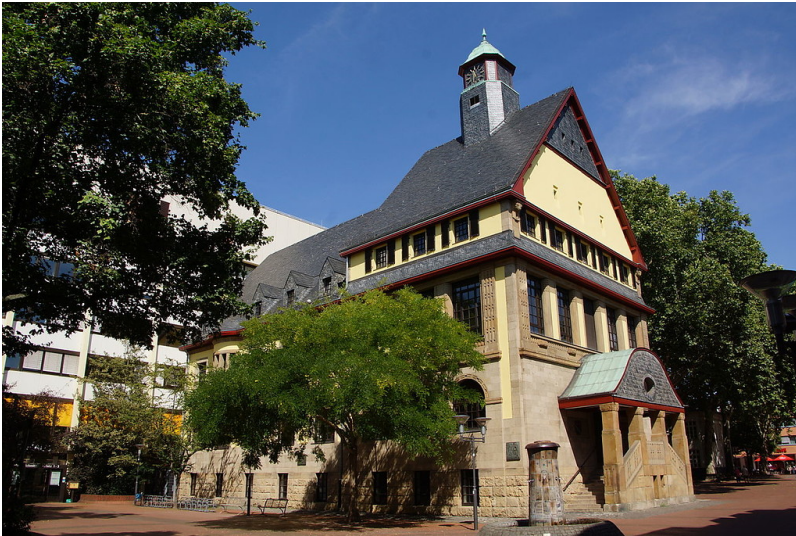
Das historische Alte Rathaus der Stadt Frechen (2014).