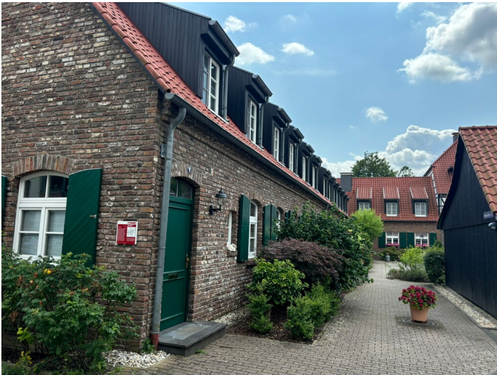
Gräfenhof in Brück (2024)